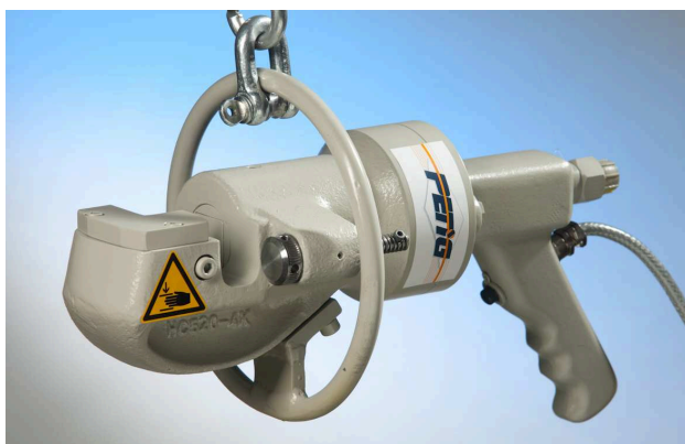
Abb. ähnlich / similar to photo