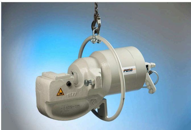
Abb. ähnlich / similar to photo