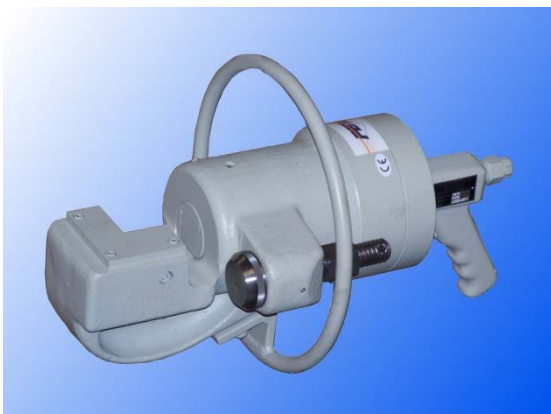
Abb. ähnlich / similar to photo